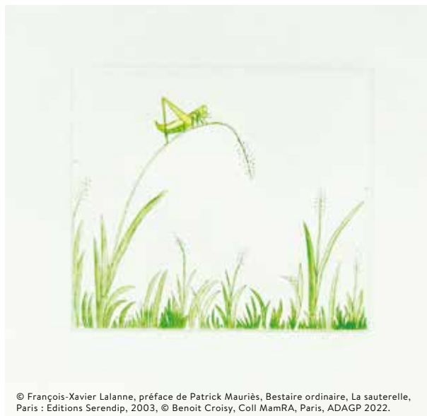
© François-Xavier Lalanne, préface de Patrick Mauriès, Bestiaire ordinaire, La sauterelle, Paris : Éditions Serendip, 2003, © Benoit Croisy, Coll MamRA, Paris, ADAGP 2022.