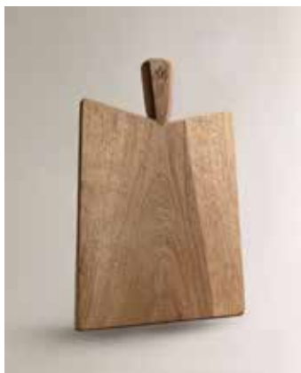
PLANCHE À DÉCOUPER

Indispensable en cuisine, façonnée en bois de hêtre, noble et durable.